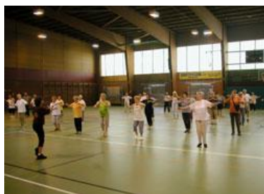
“Regionale sportdag Senioren”

Terug: Om 16u15 vertrekken de bussen aan de sporthal van Steenokkerzeel.